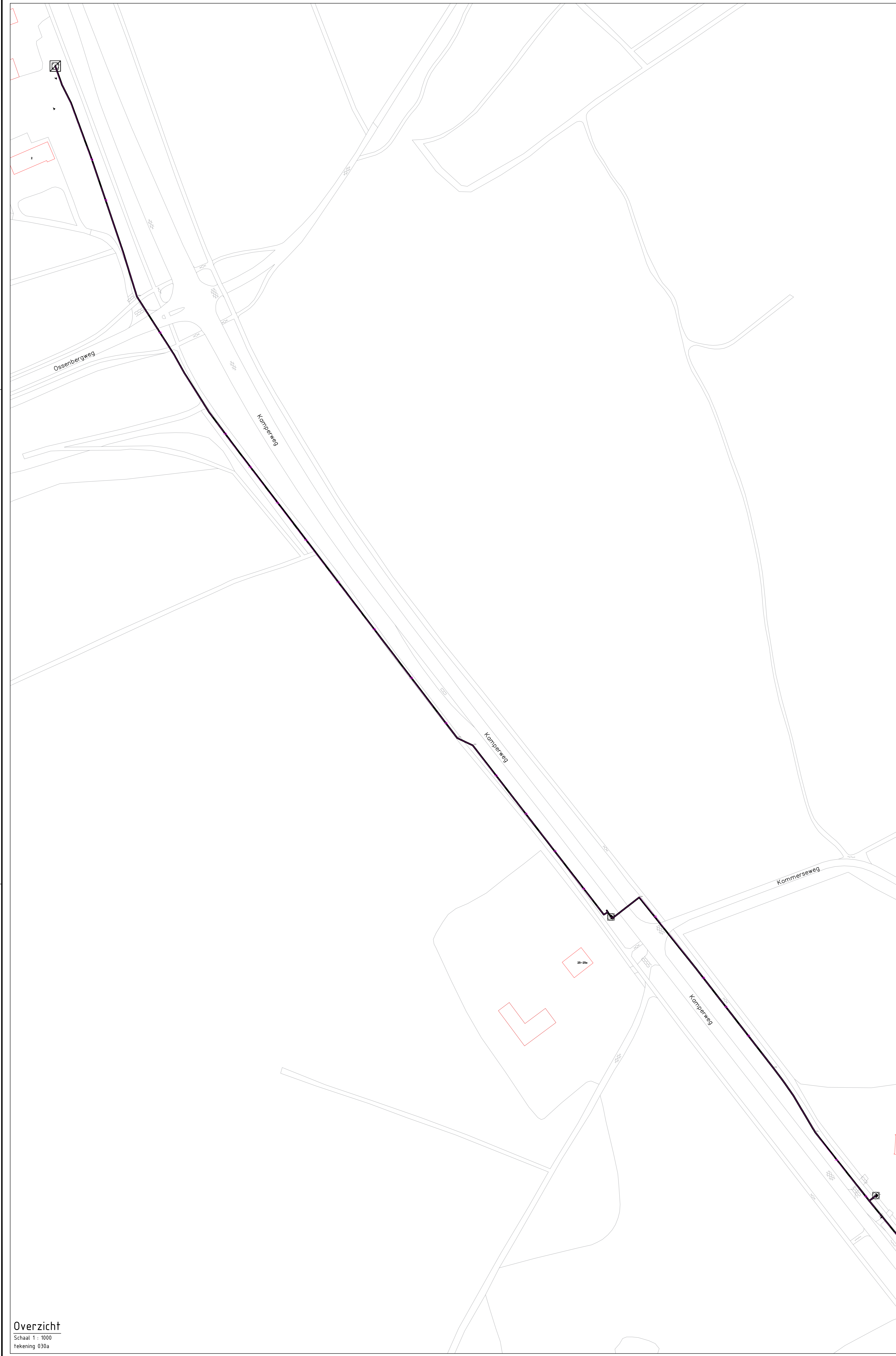
Overzicht Schaal 1 : 1000 Tekening 030a