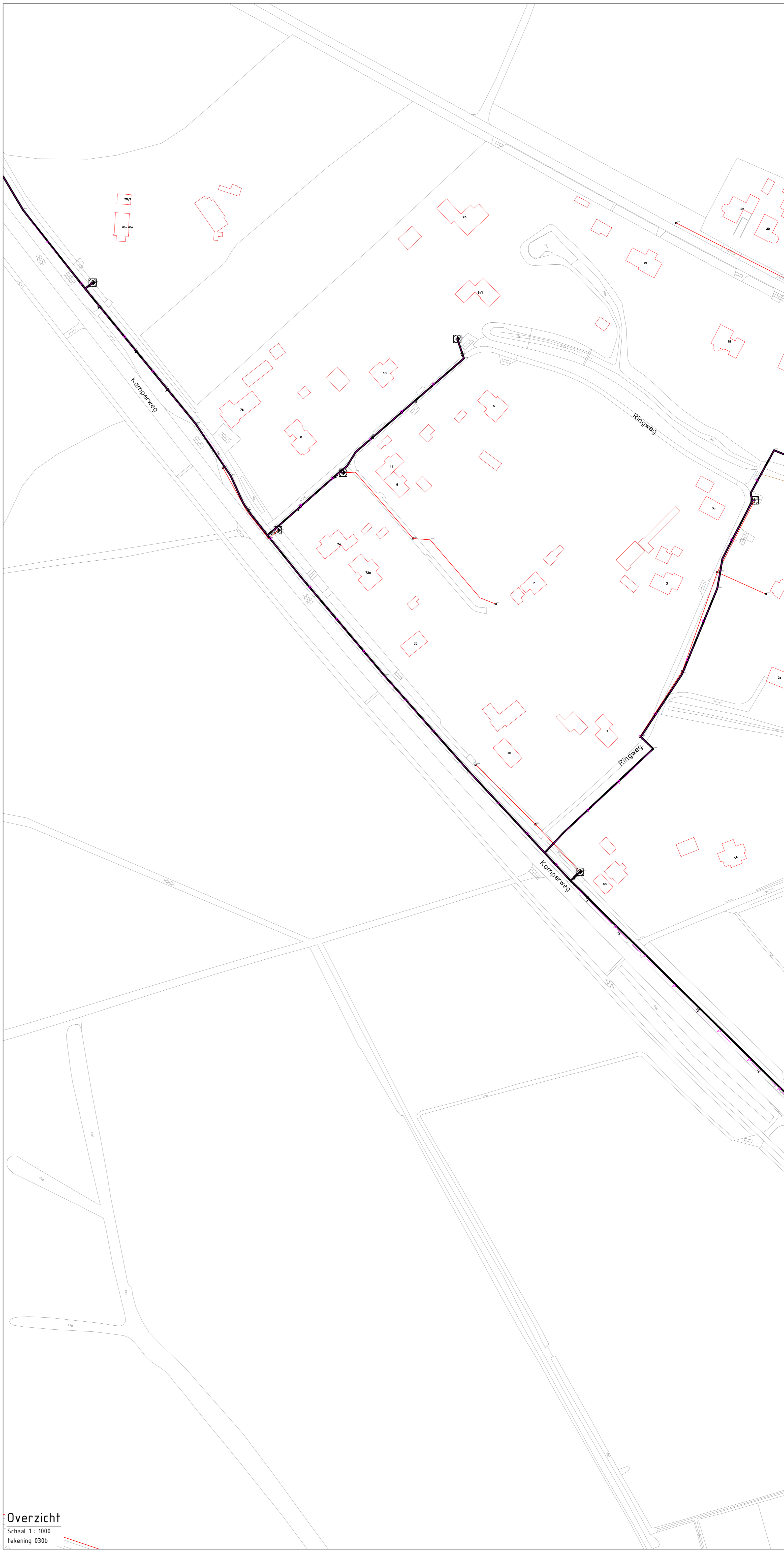
Overzicht Schaal 1 : 1000 Tekening 030b